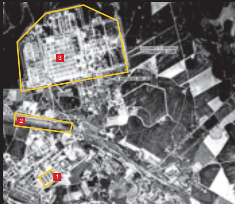
Luftaufnahme von Auschwitz-Birkenau, 26. Juni 1944. Vue générale aérienne d'Auschwitz-Birkenau, 26 juin 1944.

Le choix d'établir un Konzentrationslager à Auschwitz fut décidé en raison de l'abondance des lignes de communication et aussi des possibilités de logement déjà existantes dans les ex-casernes de l'artillerie polonaise, à la périphérie de la ville d'Oswiecim. Ces casernes existaient avant la guerre.