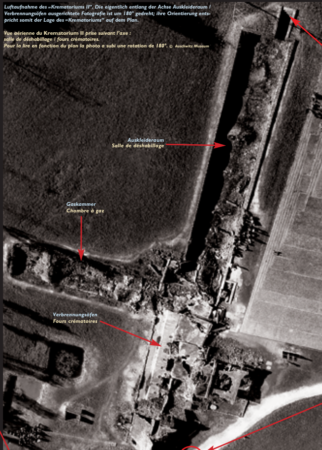
Luftaufnahme des „Krematorium II“. Die eigentlich entlang der Achse Auskleideraum / Verbrennungsöfen ausgerichtete Fotografie ist um 180° gedreht; ihre Orientierung entspricht somit der Lage des „Krematoriums“ auf dem Plan. Vue aérienne du Krematorium II prise suivant l'axe : salle de déshabillage / fours crématoires. Pour la lire en fonction du plan la photo a subi une rotation de 180°.