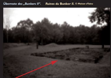
Überreste des „Bunkers II“. Ruines du Bunker II.