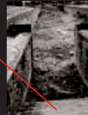
Die Stufen zum Auskleideraum. Escalier de la salle de déshabillage.