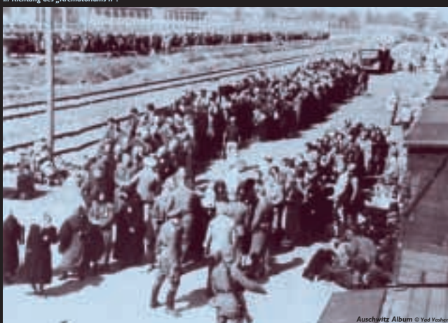
Auschwitz Album

Z iele der Nationalsozialisten waren: • die Einrichtung eines Konzentrationslagers für die politische Opposition Polens (Januar 1940), • die „Germanisierung“ des Gebiets (Oktober 1940), welches als kulturelles, architektonisches und industrielles Modellprojekt der späteren Ansiedlung „Volksdeutscher“ dienen sollte, • die Errichtung eines Lagers für sowjetische Kriegsgefangene (1. März 1941), das ab Juli 1941 zur Ermordung ihrer politischen Kommissare genutzt wurde, • die „Vernichtung durch Arbeit“ der Häftlinge mit der Errichtung eines neuen, sehr viel größeren Lagers in drei Kilometern Entfernung vom „Stammlager“ Auschwitz I: Birkenau (ab Oktober 1941).